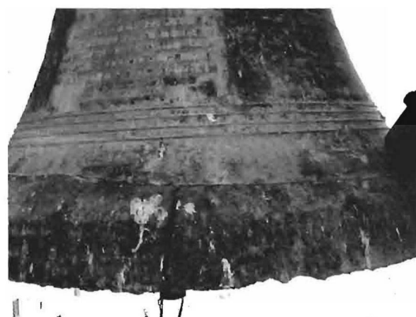
Fots. 15 y 16. Campana y detalle de la misma. 1801. Iglesia de San Andrés. Alcalá del Júcar. (TÉCNICA Y ARTESANÍA, S. L. L.).