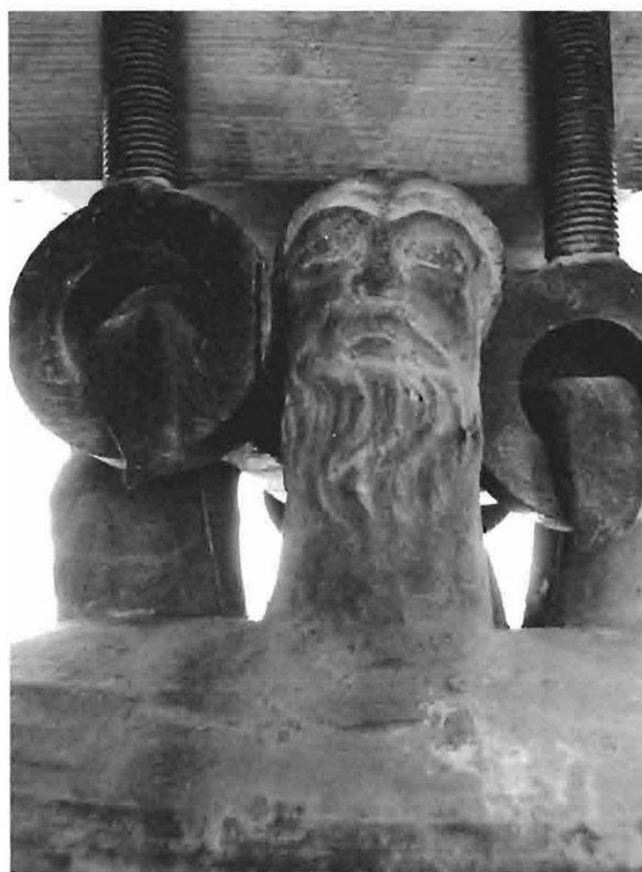
Fot. 12. Campana. Detalle. 1858. Iglesia de la Asunción. Hellín.