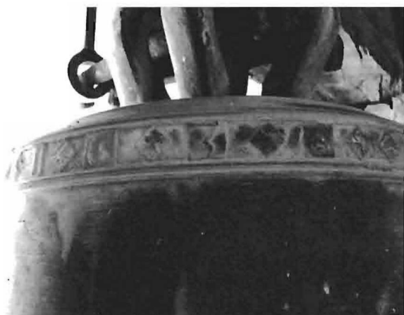
Fot. 11. Campana. Detalle. 1636. Iglesia de la Asunción. Hellín.