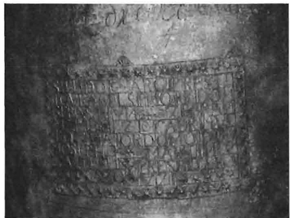
Fots. 5 y 6. Campana y detalle de la misma. 1771. Iglesia de la Asunción. Jorquera. (Fots. 2001. TÉCNICA Y ARTESANÍA, S. L. L.).

En cuanto a las advocaciones de las campanas, la nueva información confirma la tónica de dedicarlas a los santos patronos de las localidades y a los santos y Vírgenes de mayor devoción de las poblaciones o de los donantes; así ocurre en la Asunción de Hellín con la denominación de San Rafael, patrón de la ciudad, en dos de ellas: la de San Rafael mayor , llamada así por ser más grande que la otra, “+ raphael est nomen eius +” 10 y la de 1636, San Rafael menor , que lleva el nombre incluido en una oración de demanda de protección, –“ 2ANCTE RAPHAEL ORA PRO NOVI2 ”– (fot. 7). La campana de Alatoz es un ejemplo significativo de leyenda con