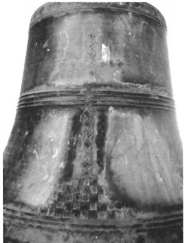
Fots. 7 y 8. Campana y detalle de la misma. 1636. Iglesia de la Asunción. Hellín.