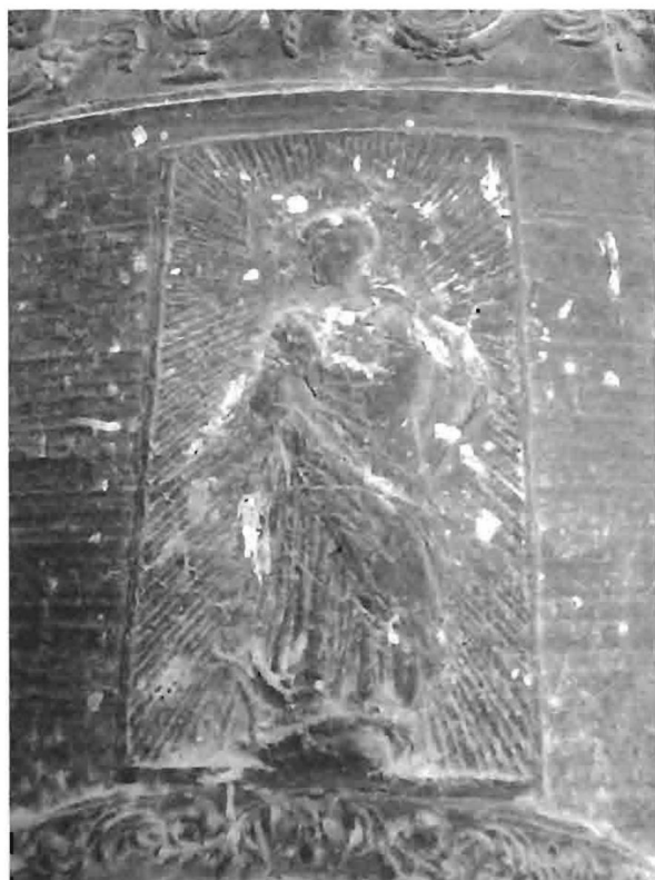
Fots. 9 y 10. Campana. Detalles. 1858. Iglesia de la Asunción. Hellín. (Fots. F. Llop).