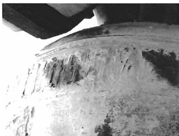
Fots. 13 y 14. Campana y detalle de la misma. 1450 ca. Iglesia de San Andrés. Alcalá del Júcar. (Fots. 2001. TÉCNICA Y ARTESANÍA, S. L. L.).