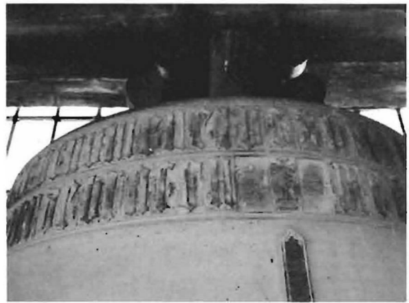
Fots. 1 y 2. Campana y detalle de la misma. 1585. Iglesia de la Asunción. Hellín.