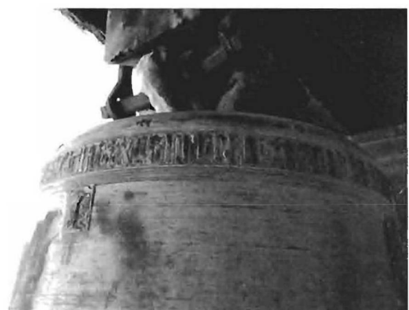
Fots. 3 y 4. Campana y detalle de la misma. 1585 (?). Iglesia de la Asunción. Hellín. (Fots. F. Llop).