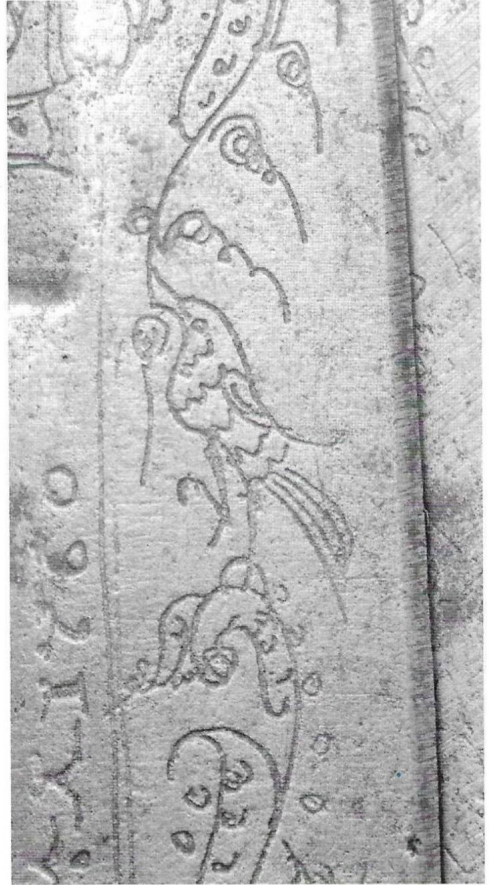
Fots. 5 y 6.- Tijeras de escritorio. Gutiérrez. 1760. Chinchilla. P. particular. Detalle de los pájaros grabados. Fots. S. Vico.