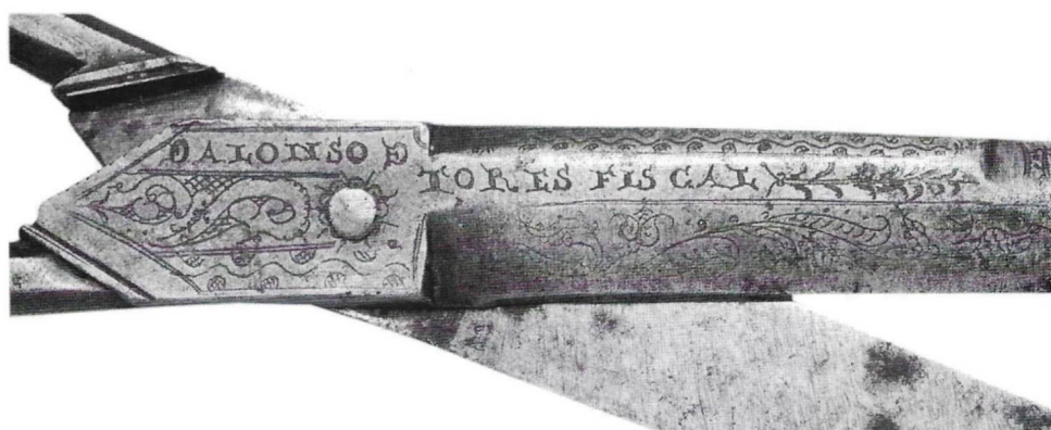
Fots. 3 y 4.- Tijeras de escritorio. Gutiérrez. 1760. Chinchilla. P. particular. Detalles de la leyenda.