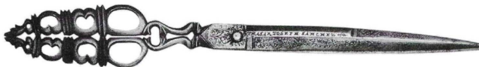
Fot. 8.- Tijeras de escritorio. Gutiérrez. 1737. Chinchilla.

angulosas las que las efectúan con el escudete; escudete pentagonal; y cuchillas de tres mesas que se reducen a dos en la mitad final. El escudete y las superficies externas de las cuchillas se cubren completamente con grabados de motivos vegetales, florales y pájaros. En una de las caras de las tijeras, y grabada con la misma distribución espacial que las anteriores, lleva la inscripción “ GVTIEREZ EN CHINCHILLA Aº DE 1751 ”.